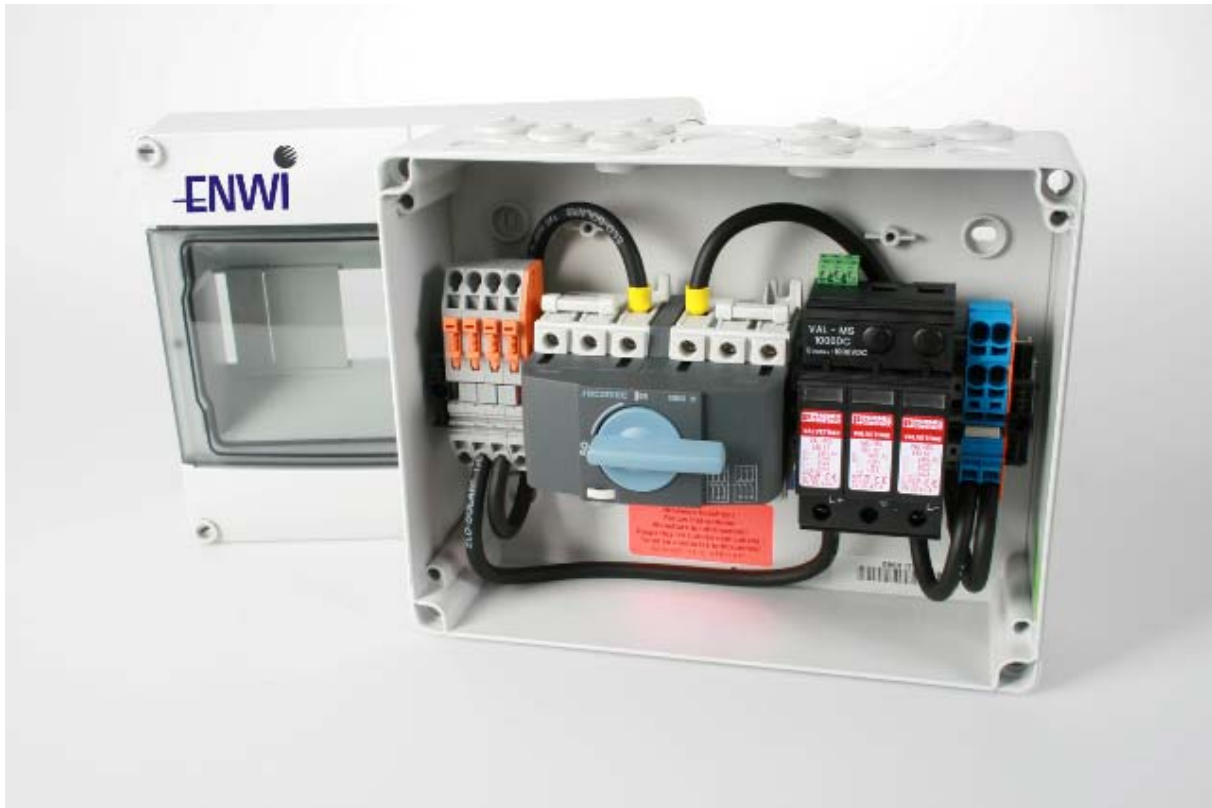
Bild: Generatoranschlusskasten von EnWi-Etec

Die EnWi-Etec GmbH ist auch Ihr Partner für die komplette Anschluss Technik von PV-Kraftwerken. EnWi bietet anschlussfertige, vormontierte und aufeinander abgestimmte Lösungen für nahezu alle String- und Zentralwechselrichter-Fabrikate.