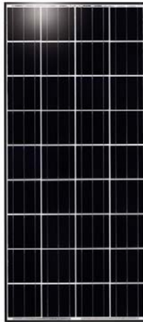
Bild: Kyocera Solar PV-Modul KD135GH-2PU für die Photovoltaikanlage bei Ökohaus-Althaus

Laut Stiftung Warentest, ähnlich dem österreichischen Konsument, gehören PV-Module von Kyocera Solar zu den effizientesten und kostengünstigsten des europäischen Photovoltaikmarktes. Kyocera Solar übernimmt eine 20-jährige Garantie auf 80% der Nennleistung seiner PV-Module. Die künftige Sonnenstromanlage von Kyocera Solar ist die ideale Ergänzung zu den energieeffizienten Elektrogeräten und den Energiesparlampen von OSRAM. Der restliche Strombedarf wird weiterhin aus umweltfreundlicher heimischer Wasserkraft von der Verbund AG bezogen.