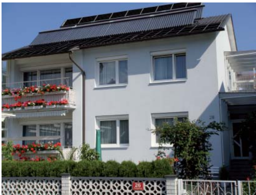
Bild: Fotomontage von Ökohaus-Althaus mit der geplanten Photovoltaik-Anlage.

Das Ökohaus-Althaus im steirischen Judenburg ist in mehrfacher Hinsicht eine durchdachte Sanierung: Ein konventionelles Einfamilienhaus aus den 60er Jahren wurde nicht nur auf ökologische Weise thermisch saniert, sondern auch mit zukunftsweisender Technik ausgestattet. Dazu wurde beispielsweise eine thermische Solaranlage für die Warmwasseraufbereitung und Heizungsunterstützung installiert. Da Gebäudeoptimierung ein steter Prozess ist, folgt nun eine Photovoltaikanlage.