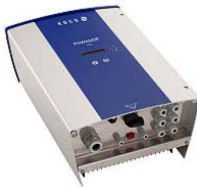
Bild: Powador 3500xi Wechselrichter von KACO new energy für die Photovoltaikanlage bei Ökohaus-Althaus

Aber auch bei der Wahl des Wechselrichters spielen neben dem optimalen Simulationsergebnis die hohen Erträge und Qualität in der Praxis eine wesentliche Rolle, weshalb die Entscheidung auf den Wechselrichter von KACO new energy gefallen ist.