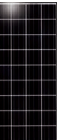
Kyocera Solar PV-Modul KD135GH-2PU für die Photovoltaikanlage bei Ökohaus-Althaus

Weitere Projektbeschreibungen auf www.oekohaus.net . Nähere Infos zur ETU Software auf www.etu.at oder telefonisch 07582-51 451.