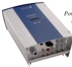
Powador 3500xi Wechselrichter von KACO new energy für die Photovoltaikanlage bei Ökohaus-Althaus

Aber auch bei der Wahl des Wechselrichters spielen neben dem optimalen Simulationsergebnis die hohen Erträge und Qualität in der Praxis eine wesentliche Rolle, weshalb die Entscheidung auf den Wechselrichter von KACO new energy gefallen ist.