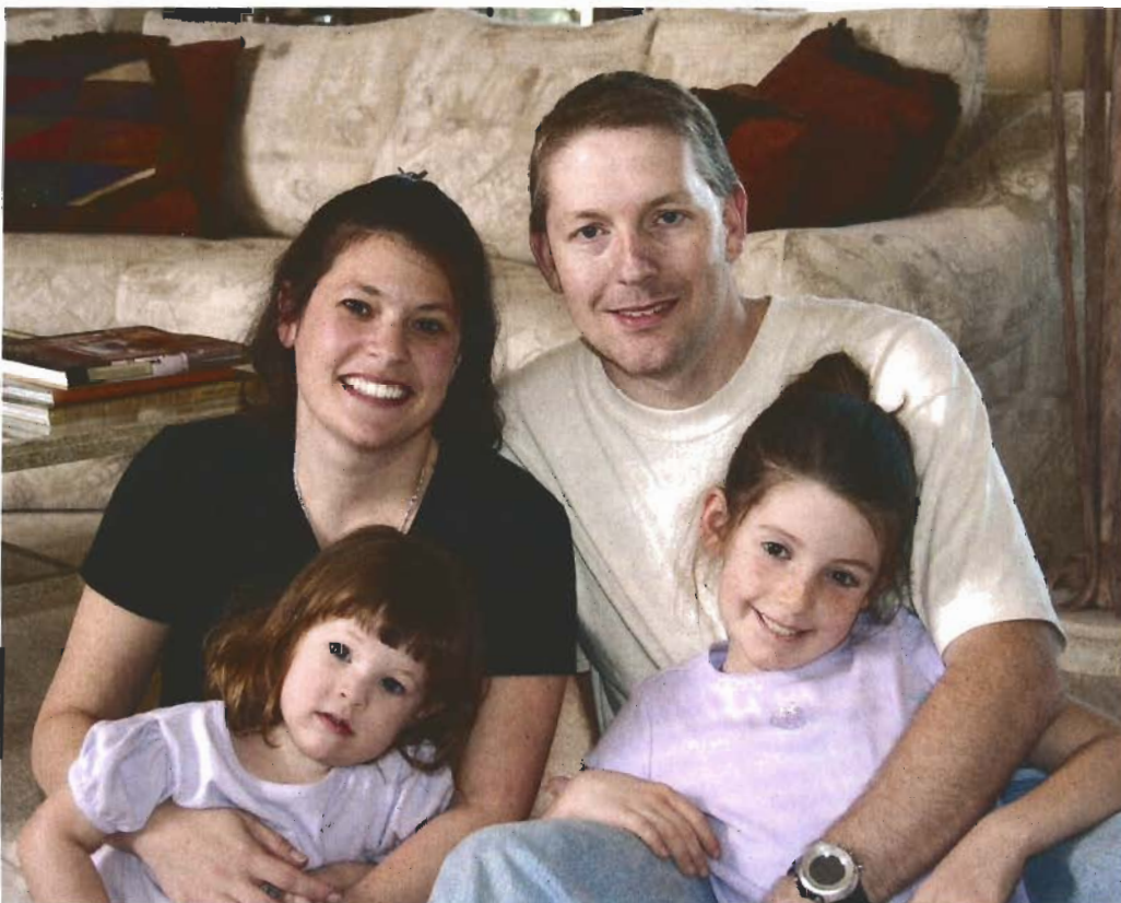
Die optimale Raumtemperatur liegt um die 20° Celsius. Eine Überhitzung schadet der Gesundheit.

In Österreich setzt die Solarwirtschaft zurzeit rund 140 Millionen Euro jährlich um und ist somit zu einem boomenden und