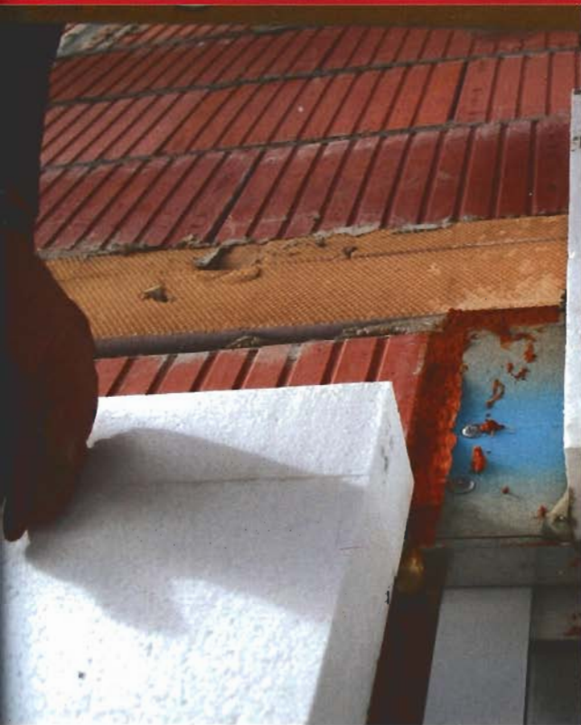
Fachgemäße Wärmedämmung des Wohnhauses hilft Energie und Geld sparen.